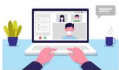
图 1 第一机位示意图

手机)从考生侧后方 45° 距离本人约 30cm 处,确保第一机位和第二机位分别从考生正面和侧身后完整拍摄到考生全身,监考人员能够从第二机位清晰看到第一机位屏幕。示意图如下: