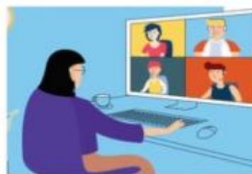
图 2 第二机位拍摄效果示意图

3. 提前进行网络测试,网络良好能满足复试要求,保障条件应包括:有线宽带网、WIFI、4G 或 5G 网络等两种以上网络条件,建议电脑采用有线宽带连接、手机采用 4G 或 5G 信号和 WIFI 双模式进行面试。手机和笔记本电脑须注意提前充满电,手机改为勿扰模式,防止考试期间电话接入干扰考试。